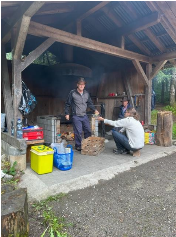
Das Feuer wurde profimässig angefacht was das Zeug hält!